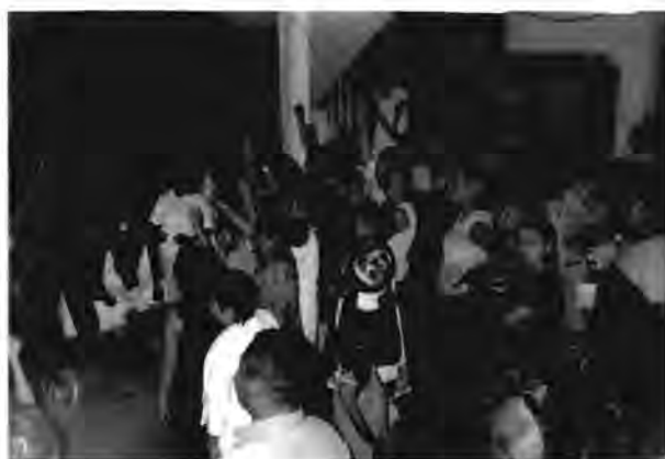
Líderes de colonias celebrando a las afueras del PRI estatal el triunfo del Partido después de saber los primeros resultados (a través de la radio y televisión locales) de las elecciones correspondientes a presidente municipal y diputados de distritos locales en febrero de 2002.

Las actividades de las lideresas tienen un objetivo bien definido, algunas de ellas con trayectoria, otras aún iniciando y sin comprender algunas de las cosas que hacen, pero, son mujeres que continúan en la lucha por alcanzar ese objetivo y quizá el más importante para sus representantes y coordinadores, que es llevar a cada uno de los candidatos del PRI al triunfo.