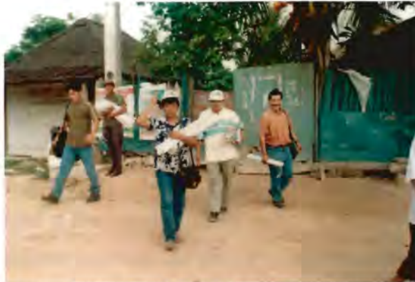
Líder con equipo de colaboradores en activismo político: reparto de propaganda y registro de promovidos días antes de las elecciones del 17 de febrero 2002.

Se clasificaron considerando que estos son los diferentes momentos observados durante el proceso electoral en el que las actividades de las lideresas varían y tienen el objetivo de lograr simpatizantes y votantes a favor del PRI.