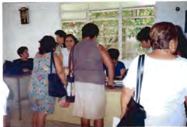
Líderes de diferentes colonias en la oficina de la CNOP realizando trámites de apoyos diversos ante la dirigente inmediata.

Enfocándonos específicamente a nivel local, queremos mencionar la posición que ya tienen las mujeres en el partido, a través de organizaciones que las coordinan y formalizan su nombramiento con credenciales como líderes seccionales, populares y activistas del partido, con funciones específicas.