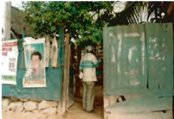
Exterior del domicilio de una líder en la colonia Protterritorio durante el tiempo de procesos electorales del 2002

Ser líder de colonia, también es tener un domicilio que hace propaganda al PRI los 365 días del año, sobretodo en épocas de campañas, propagandas de todo tipo y tamaño son característicos de sus viviendas, llegando a formar parte de la decoración permanente.