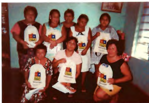
Paquetes escolares que se les ofrecen a los vecinos al inicio del ciclo escolar como apoyo y gratificación por participar en las actividades durante todo el año.