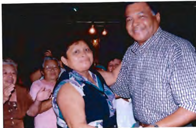
Líder de la colonia Miraflores bailando con el actual gobernador del Estado en la fiesta de navidad organizada exclusivamente para ellas en diciembre de 2002.

Haberse tomado una fotografía con un actor famoso y haber bailado con el Gobernador en la fiesta de navidad