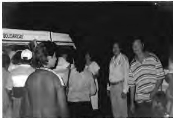
Líder en una labor de acarreo de vecinos para el cierre de campaña de los candidatos a presidente municipal y diputados de distritos locales 2002 en Chetumal, Quintana Roo.

Esta labor realizada por cada una de las líderes en sus colonias, se observó en las campañas correspondientes a febrero de 2002.