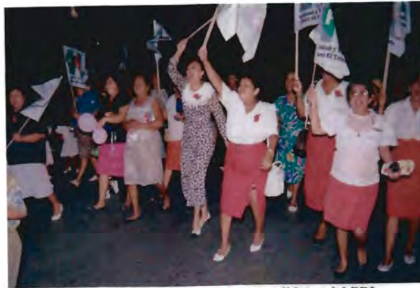
Marcha de líderes en apoyo a candidatos del PRI

Cada una en su momento, siendo aún lideresa o al dejar de serlo, tendrá las satisfacciones de haber apoyado al PRI en marchas, campañas y elecciones.