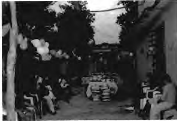
Fiesta del Niño y la Madre organizada por una líder en el patio de su casa el mes de mayo de 2002 para los vecinos de su colonia que participan en sus actividades. Obsérvense los regalos: despensas, utensilios de cocina y juguetes que se repartieron y que fueron reunidos por la lideresa.

Una vecina comentó al respecto: “Nuestra líder nos invita a reuniones y convivios para los niños, el 30 de abril, día de la madre y navidad que hace para todos los de la colonia, ella trabaja bien” 78 .