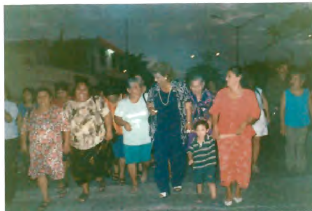
Marcha de líderes con la candidata electa a diputada por el I Distrito local el día de la entrega del Acta de Mayoría de Votos.

Y sobre todo haber logrado el triunfo de los candidatos de su partido, en las elecciones de febrero de 2002.