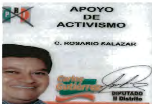
Credencial que portan las líderes al realizar el activismo político. Esta fue portada por la Líder de la colonia Proterritorio durante los procesos electorales de 2002

De una manera clara, se distingue la actuación de la líder en campaña, el hecho de visitar y contactar a 652 personas de un total de 968, denota la capacidad de comunicación y convencimiento que tiene para lograr la confianza de sus vecinos y por consiguiente los datos (número de posibles votantes de su colonia o el registro de promovidos) que necesita para cumplir con su Partido.