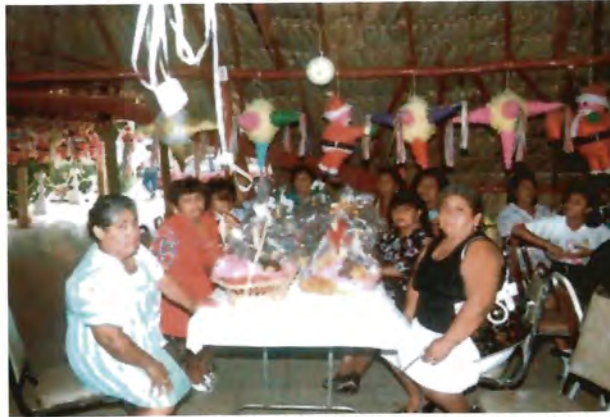
Líderes de colonias en la reunión donde los funcionarios del PRI les entregaron para ellas y sus familias piñatas y canastas navideñas.

Y sobre todo haber logrado el triunfo de los candidatos de su partido, en las elecciones de febrero de 2002.