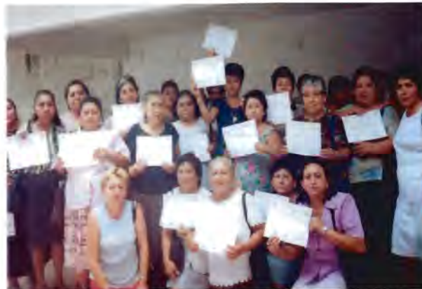
Líderes de colonias populares, minutos después de haber recibido su reconocimiento el 18 de abril de 2002 por su trabajo como activistas en las campañas del 2002

“Líderes de colonias populares y seccionales, el PRI ha confiado a la CNOP la responsabilidad del proceso electoral, y es por esta labor, la labor de cada una de ustedes líderes, en las colonias populares, que se ganó las elecciones. Agradezco a cada una de ustedes su labor y las exhorto a seguir trabajando por el PRI y para que en las próximas elecciones se lleve el carro completo” 52 .