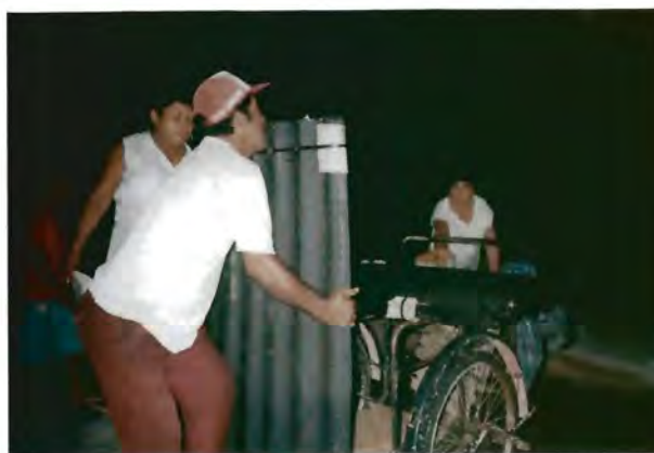
Láminas de cartón que entregan las líderes a vecinos, ya sea en temporadas de lluvias o cuando así lo solicitan.