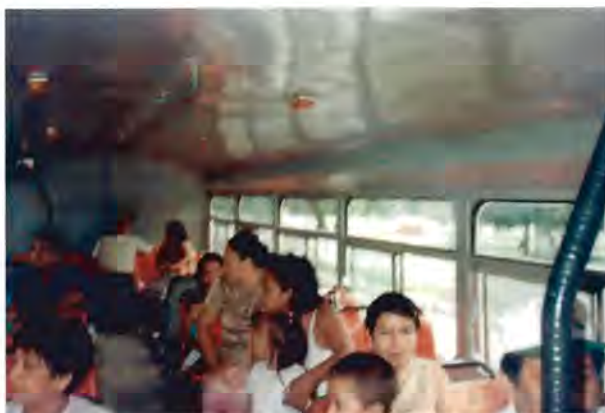
Interior de un camión urbano que transportaba a los vecinos de una colonia hasta el centro de votaciones el 24 de febrero de 2002, para las elecciones internas del PRI a presidente del partido.

Para ellas el día de las votaciones, es un día intenso en actividades, emociones y pensamientos, pues su labor como líder y promotora del voto continúa ese día al coordinar y llevar al centro de votaciones un gran número de vecinos previamente citados.