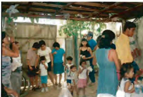
Personas que asistieron a votar y que posteriormente acudieron al domicilio de la líder “Casa Amiga” de colonia junto con sus hijos para compartir los taquitos. Nótese como la mayoría son mujeres, recompensa por depositar el voto.

Estos cambios, se visualizan considerando que los candidatos ganaran el puesto representativo al que aspiraban y los vecinos por su parte, al votar se hacen acreedores a jugos, tortas, o fiestas con las líderes, además de cantidades en efectivo y beneficios concretos como los que ya se han mencionado a lo largo del trabajo. En este caso específico, la relación clientelar pactada durante las campañas se fortalece más, puesto que los bienes recibidos en esta etapa del proceso no son necesariamente indispensables para los vecinos, más bien cumplen un papel gratificador