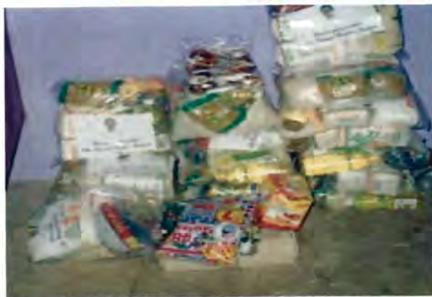
Paquetes de despensa otorgados a una líder de colonia para que reparta a los vecinos que apoyaron el activismo electoral durante la campaña interna del PRI para elegir al presidente nacional en febrero de 2002.

“A mi en lo personal, siempre me ha apoyado, no tengo queja de la líder, me ha apoyado con láminas, escombros, mercancía, cuando llega alto el recibo de agua o luz, vamos con ella a CAPA y gestiona para que paguemos menos, cuando me operaron ella gestionó mis medicinas” 77 .